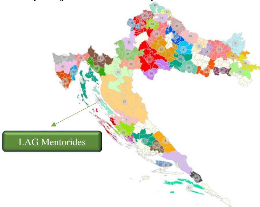
Slika 2: Karta položaja LAG-a na karti Republike Hrvatske