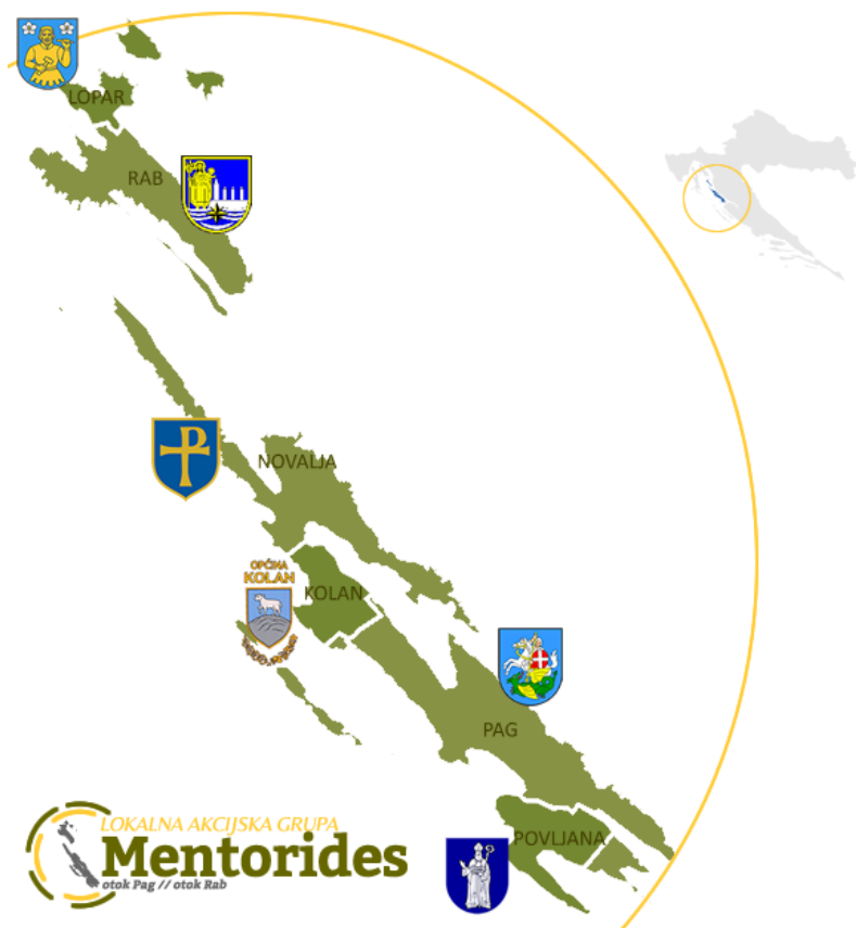
Slika 1: Karta LAG područja s vidljivim granicama JLS-ova u LAG-u